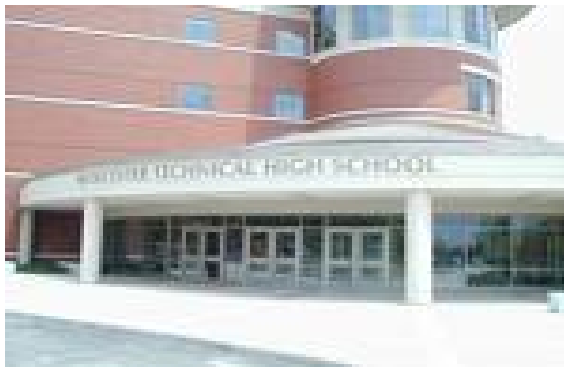
high school (liceu)